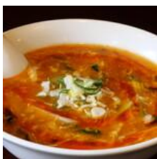
酸辣湯麵（サンラータンメン）

私、酸辣湯麵（サンラータンメン）が大好きです。酸辣湯は、四川料理のスープのひとつで、酢の酸味と唐辛子や胡椒の辛みと香味を利かせた、酸味豊かな辛みのあるスープで、具材は、豆腐、とり肉、シイタケ、キクラゲ、タケノコ、長ネギ、卵、トマトなど、とても辛くて、すっぱく、これが何とも言えないんですね。中国では、このスープだけを食するのですが、日本のとある中華料理店さんが、このスープに麵を入れたのが、酸辣湯麵の初まりです。残念ながら、エリヤ神岡さんには、このメニューがなく、私が知っている限りで、このメニューがあるのが、大曲の鳳仙花さん、一軒だけです。でも、鳳仙花さんは、いつ行っても混んでいるし、不定休なので、なかなか食べることが難しいです。ですので、次のページに酸辣湯のつくり方を紹介しております、ぜひ、参考にしてくださいませ。