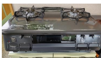
水無し片面焼きグリル 希望小売価格￥51,810（税込）を ズバリ！￥25,300（税込）