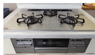
PD-743WS-75GH 希望小売価格￥210,100（税込）を ズバリ！￥110,000（税込） ラ・クックグラン付きです!!